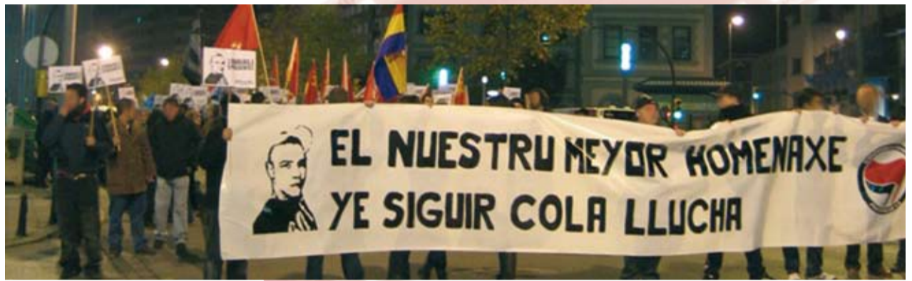
Contra la violencia Fascista. Nuestro mayor homenaje es seguir con la lucha - Xixon