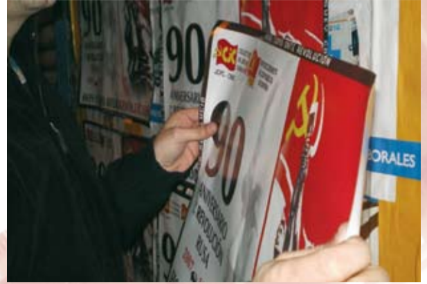
90 Aniversario de la Revolución Rusa - La Rioja