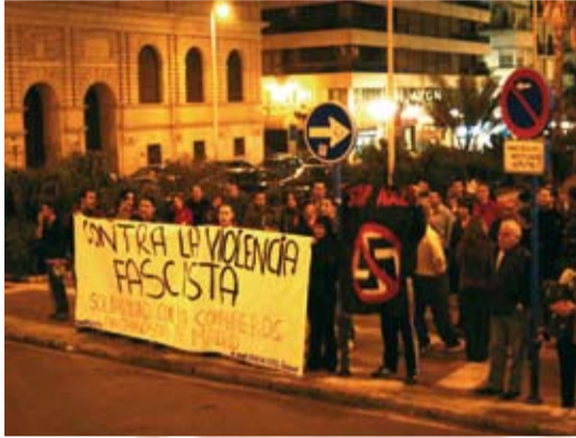
Contra la violencia fascista - Alicante