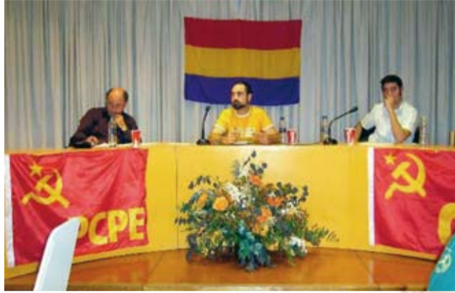
90 Aniversario de la Revolución Rusa - Móstoles