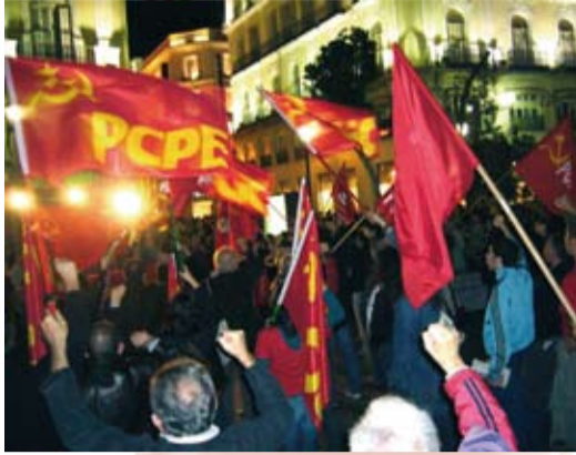
90 Aniversario de la Revolución Rusa - Madrid